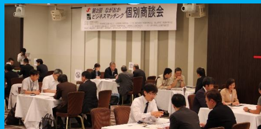
<商談イメージ(第2回の様子)>